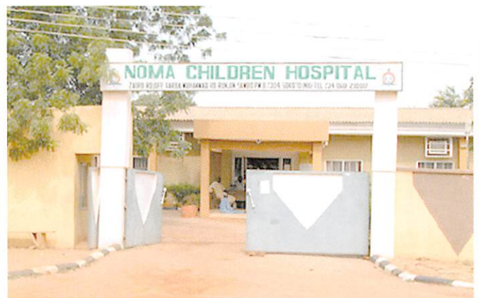
Noma Children Hospital • www.noma-hospital.org

Das Noma-Kinder-Hospital kann als Zentrum zur Bekämpfung von Noma in ganz Westafrika betrachtet werden. Derzeit ist die Klinik mit 75 Patientenbetten und einer Basiseinrichtung für Angehörige ausgestattet und wird von einheimischem Vollzeit-Personal versorgt. Wichtig ist die Weiterbildung der nigerianischen Chirurgen und Anästhesisten in Europa, die sie befähigt, die kompetente Vor- und Nachsorge sowie kleine Operationen vorzunehmen. Von hier aus sollen Pfleger geschult und für Aufklärungs- und Impfkampagnen entsandt werden.